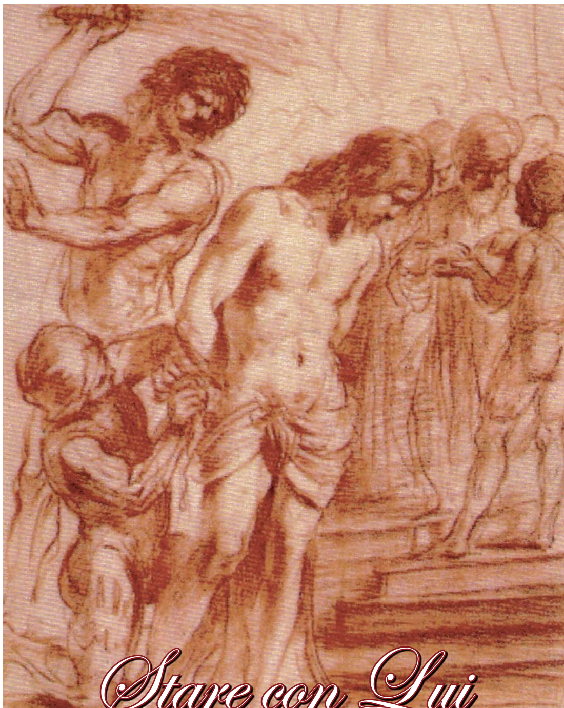
Guercino, Flagellazione di Cristo , sec. XVII, Genova, Palazzo Rosso