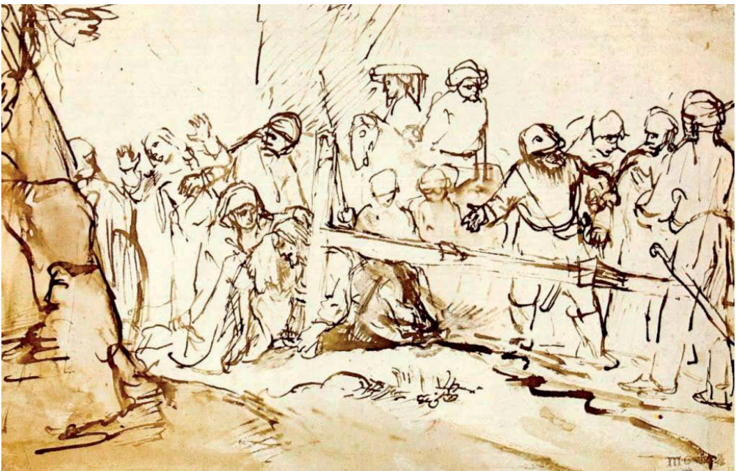
Rembrandt, Cristo e la Veronica , 1655-1660, Haarlem, Teylers Museum