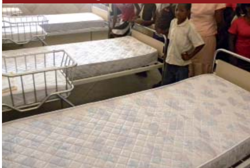
Arredamento degli interni