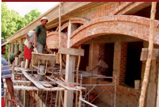
Completamento degli esterni