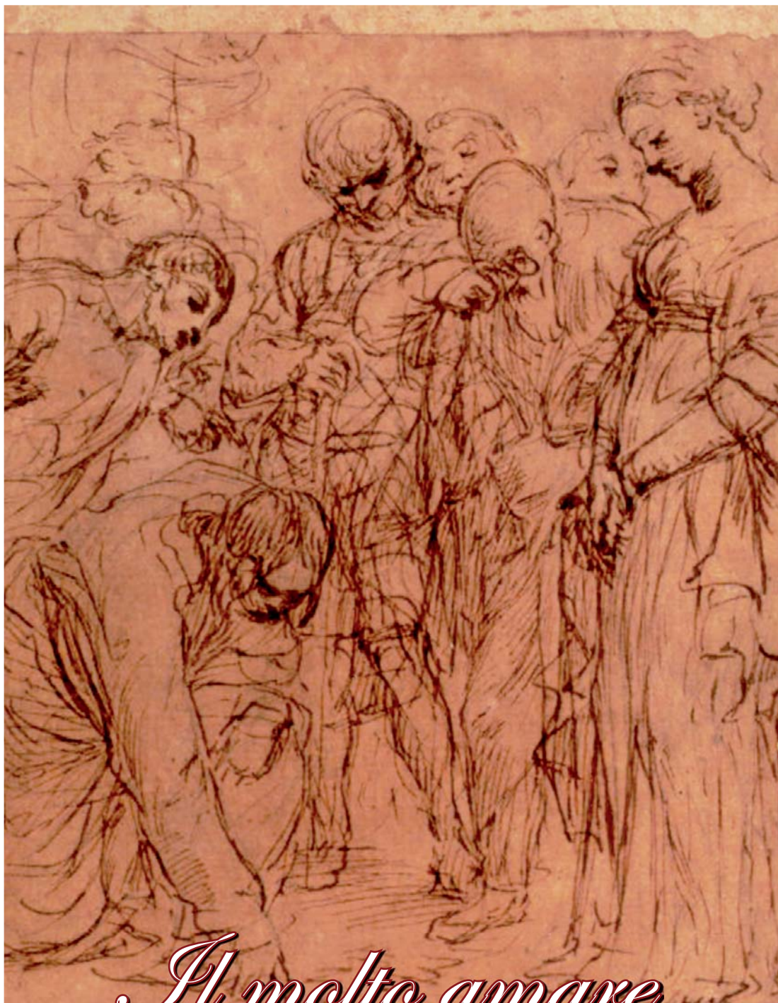
L. Mehus, Cristo e l'adultera, sec XVII, Londra, The Courtauld Gallery