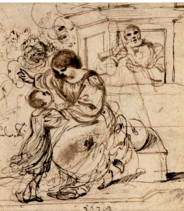
G. Caletti, Sacra famiglia , 1628, Londra, The Courtauld Gallery

di prova della sua verità. Non saranno infatti «né le lacrime, né i piaceri, né le tenerezze» (V 11,13) a certificare la qualità della nostra preghiera, ma saranno la «giustizia, la forza d'animo e l'umiltà» con cui ci disporremo a servire il Signore, a seguirlo ovunque Egli ci condurrà. Pregare è, allora, l'occasione per tornare a dire ogni volta con maggiore verità quel «sia fatta la tua volontà» che il Maestro ha messo nella bocca e nel cuore di ogni suo autentico discepolo. Ed in quello sguardo che Teresa ci invita a cercare nella nostra preghiera, il vero cristiano comincerà ben presto a scorgere le lacrime di un Dio che si commuove per il morire dei suoi figli, per il loro ricadere nel peccato. «Unite il vostro pianto a quello di Dio» (Escl. 10): l'acorato appello della Madre irrompe nella nostra orazione e ne estirpa ogni pretesa intimista per trapiantarla nel fecondo orizzonte apostolico della Chiesa. Non c'è testimonianza migliore di questa per scongiurare quella fuga mundi di