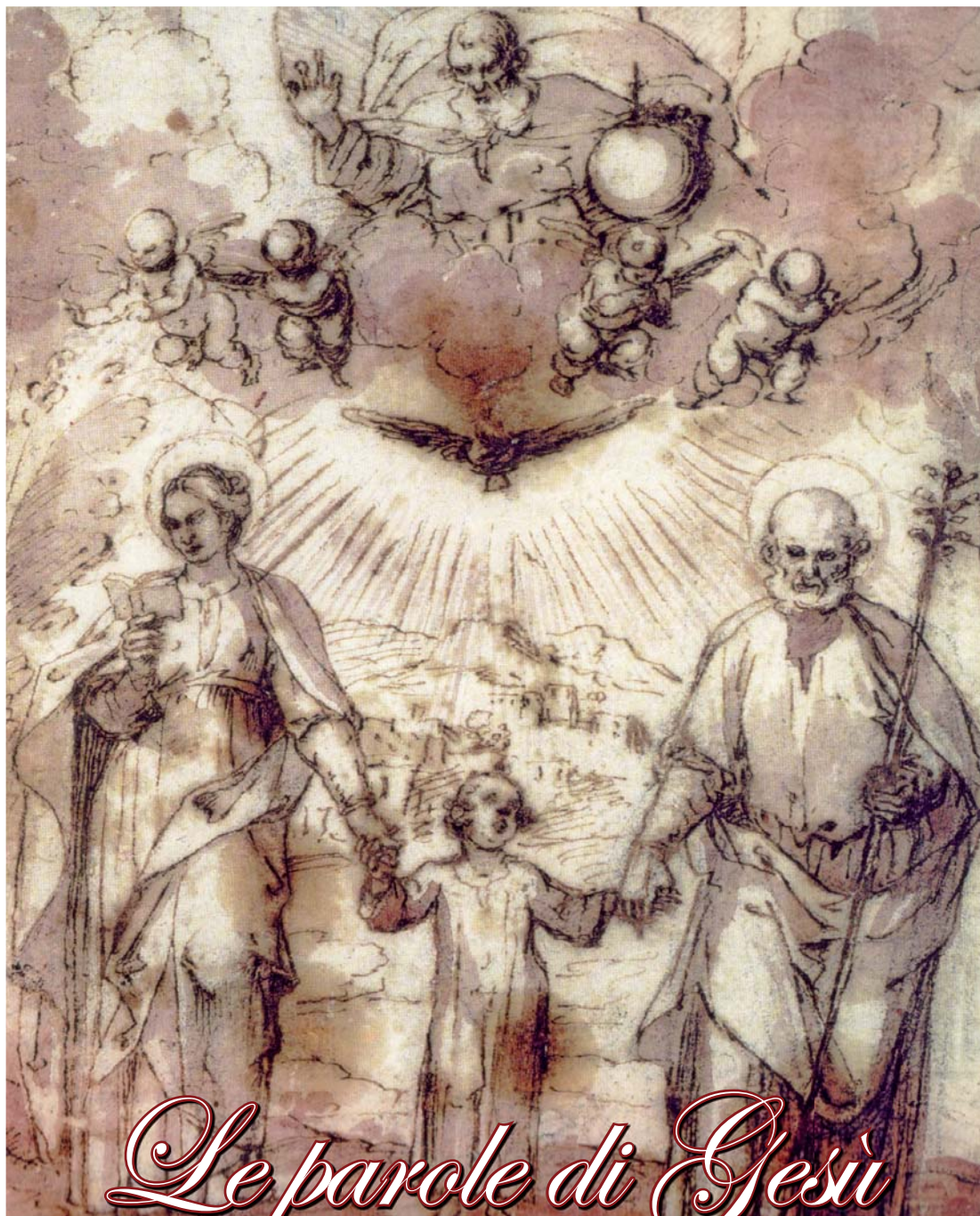
B. Corenzio, Sacra Famiglia , sec XVII, Palermo, Galleria Regionale della Sicilia Palazzo Abatellis