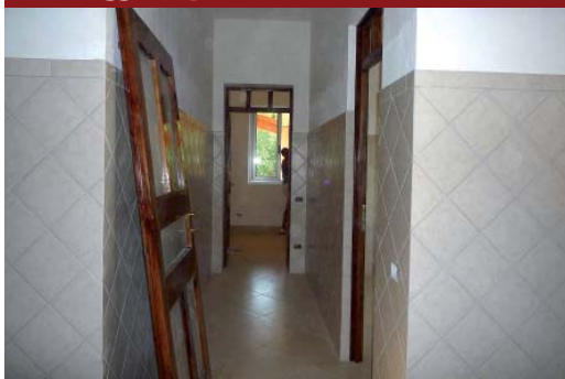
Montaggio di porte e finestre