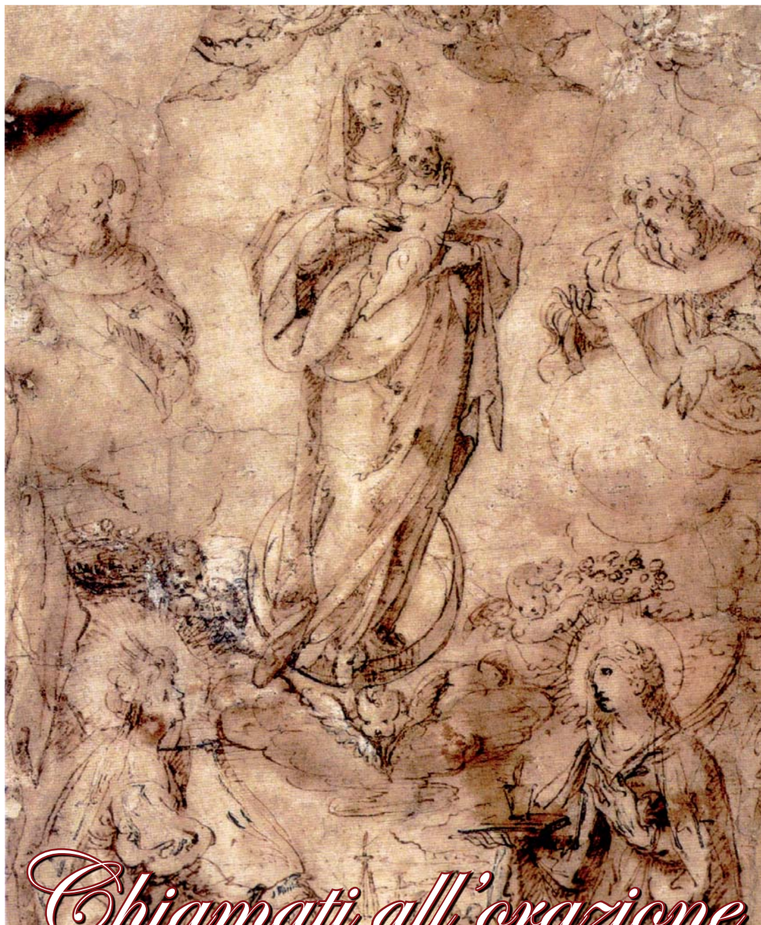
M. Smiriglio, Madonna con bambino tra i profeti Elia ed Eliseo e le sante Ninfa e Orsola , sec XVII, Palermo, Galleria Regionale della Sicilia Palazzo Abatellis