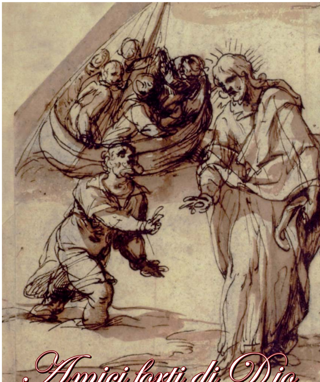
C. Cignani, Cristo cammina sulle acque , sec. XVII, Londra, The Courtauld Gallery