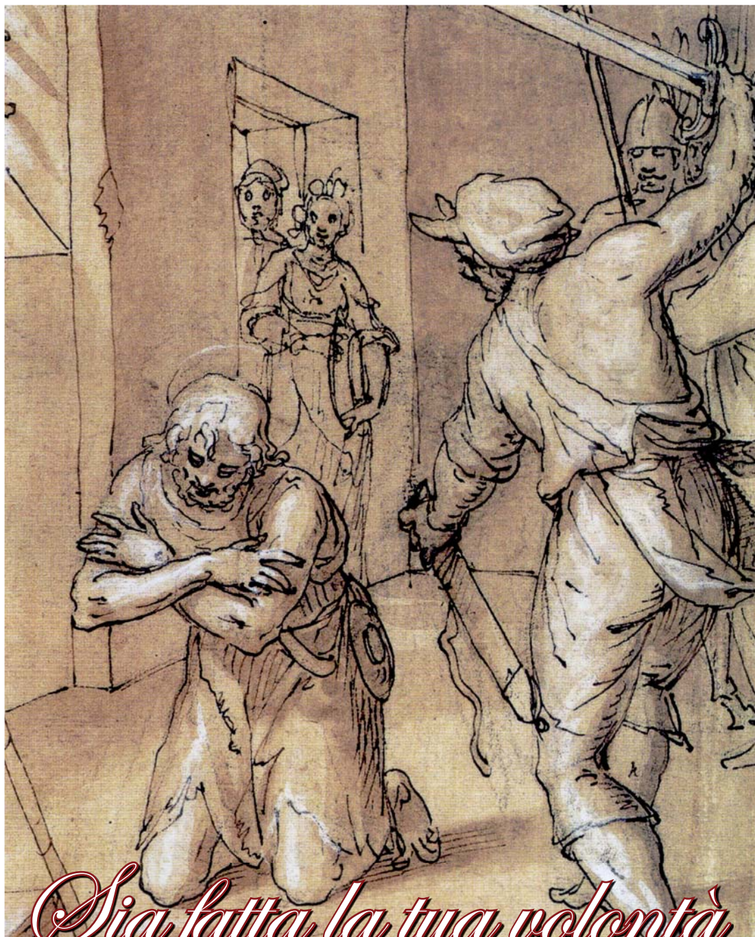
G. B. Paggi, Decollazione del Battista, sec XVII, Palermo, Galleria Regionale della Sicilia Palazzo Abatellis