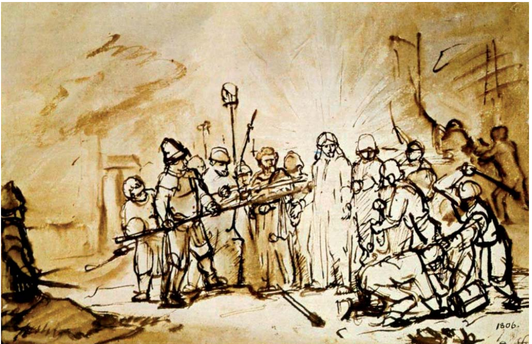
Rembrandt, Cattura di Cristo nell'orto degli ulivi , 1655-1660, Stoccolma, Nationalmuseum

In questo incontro con il Signore che è l'orazione, tutto risponde alla logica dell'amore, o come direbbe Teresa, dell'amicizia, perché di questo si tratta: pregare, per lei, è «prenderci questo Dio come amico... un intimo rapporto di amicizia... un frequente incontro da solo a solo» (V 8,5).