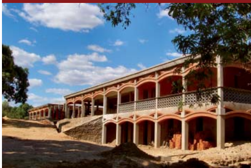
Reparto maternità "Geppo Dimartino"