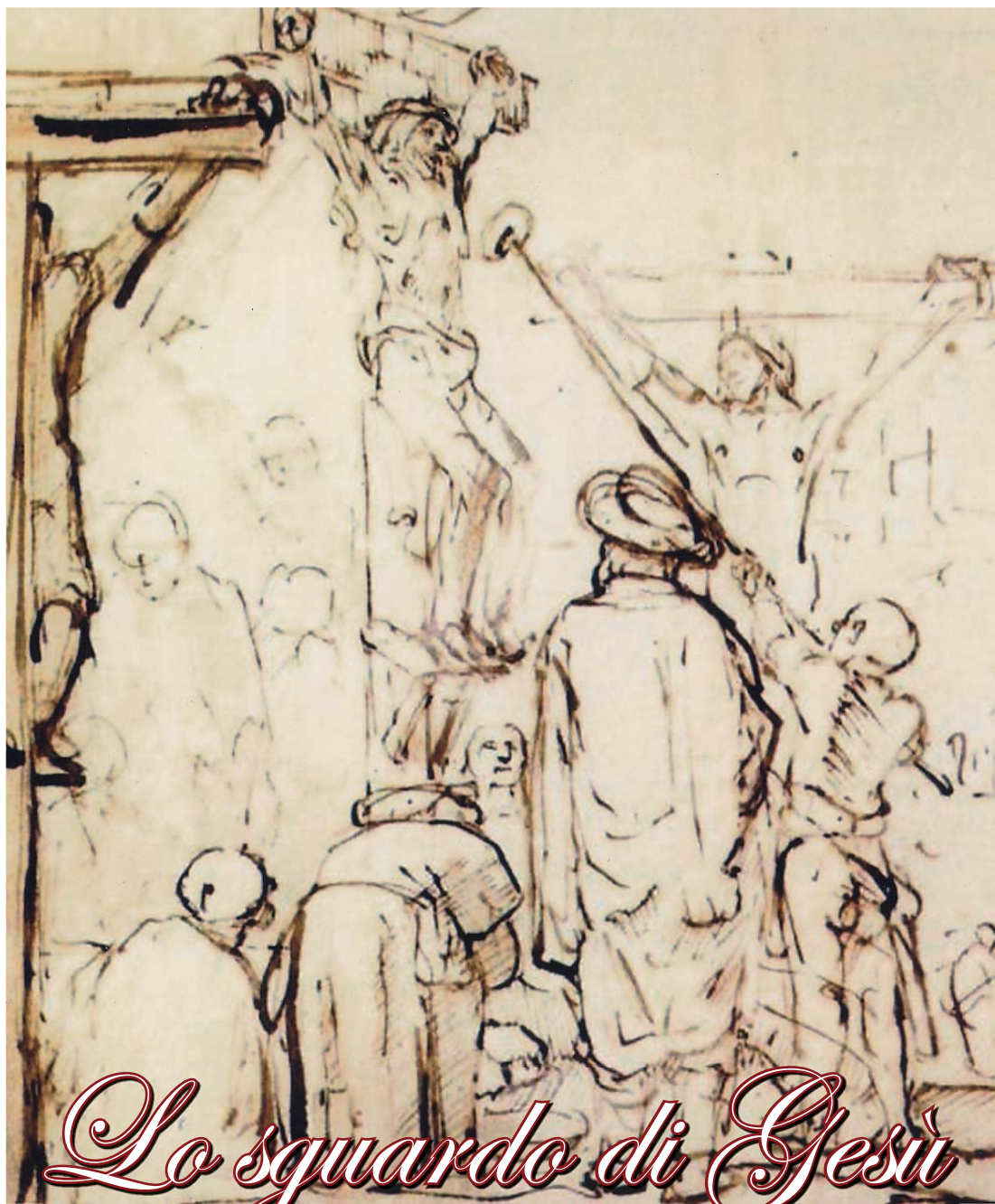
Rembrandt, Crocifissione, 1650-55, Parigi, Museo del Louvre