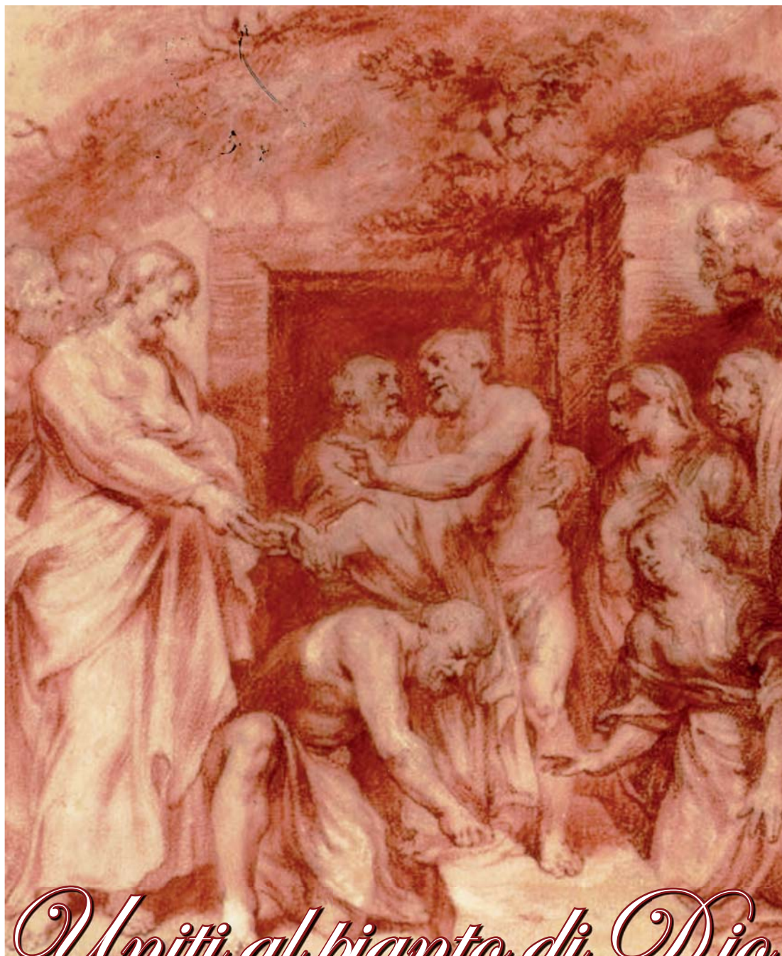
G. Muziano, Risurrezione di Lazzaro, 1600-1608, Londra, The Courtauld Gallery