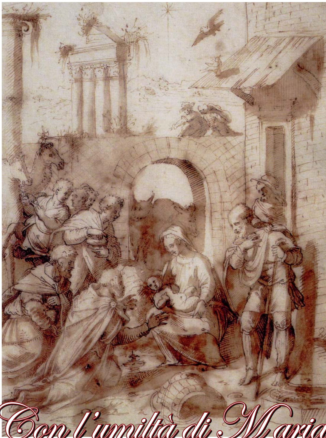
Anonimo Fiammingo, Adorazione dei Magi, sec XVI, Palermo, Galleria Regionale della Sicilia Palazzo Abatellis